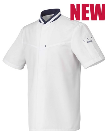
Blanc - Marine