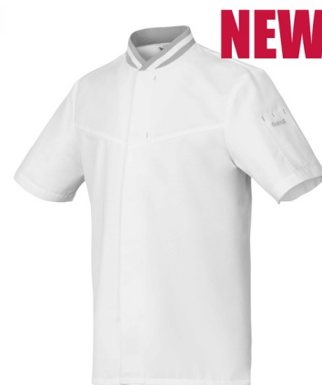
Blanc - Gris